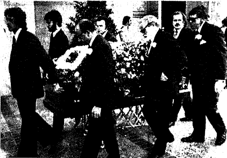
جثمان الأميرة فتحية محمول داخل صندوق خشبي فى طريقه للدفن فى إحدى الكنائس الأمريكية !!